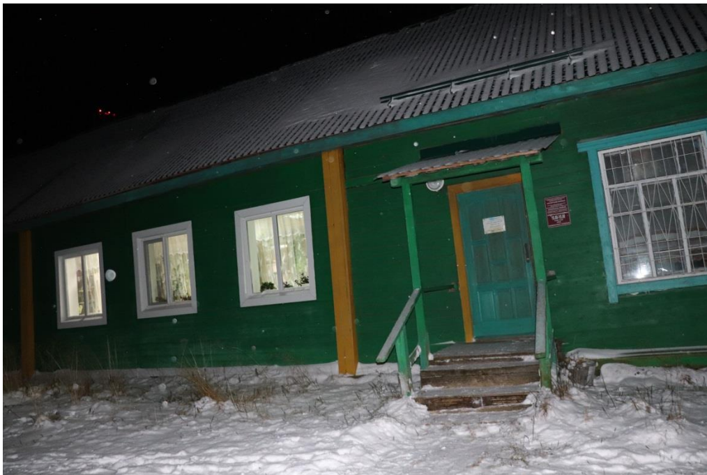
Вход в библиотеку

Входная дверь: ширина 0,8 м.; высота порога 17 см.; отсутствует тактильная предупреждающая полоса перед дверью