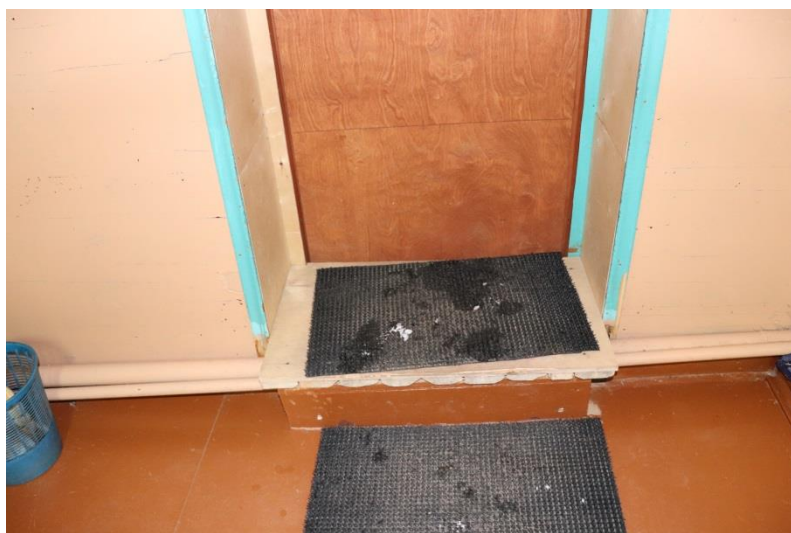
порог входной уличной двери внутри здания

Внутри помещения высота порога составляет от 4 см до 18 см